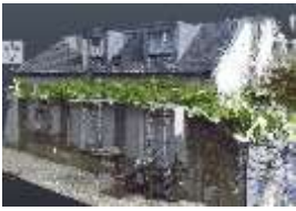
Nuage de point existant