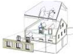
Etudes de projet